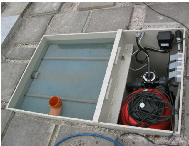
Der Schacht braucht nur wenig Platz in unmittelbarer Nähe des Pools.