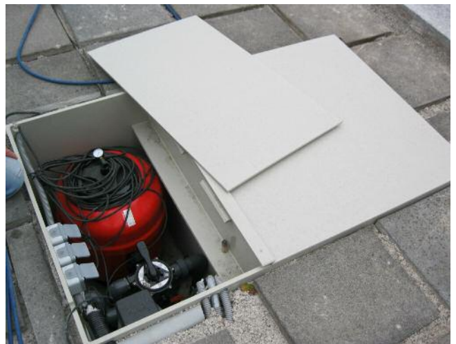
Mit zwei handlichen Deckeln wird der Schacht abgedeckt. Der gesamte Schacht kann aufgrund seiner tiefen Lage gut verborgen werden.