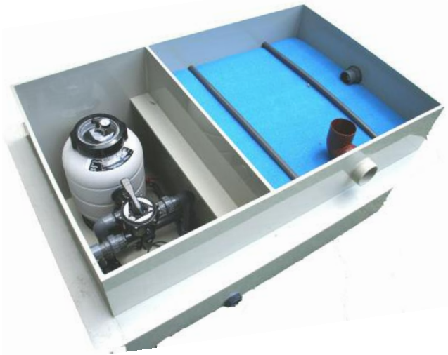
Der Schacht vor dem Einbau. Kompakte Technik auf 2,0 x 1,2 x 0,8 Meter.