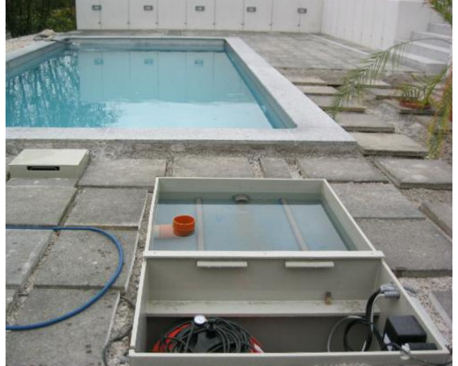
Der Pool im Hintergrund bleibt nahezu unverändert.